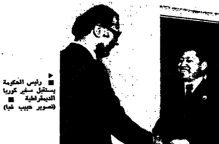
رئيس الحكومة يستمع من كورنا الديمقراطية

بعد الاجتماع قال الوزير اليزري: لقد بحثنا مواضيع تخطيط مدينة بيروت والمراحل التي قطعتها الدراسات حتى الآن، وبحثنا قضية المباشرة والتنفيذ والجوانب الاقتصادية والمالية لمشروع تخطيط مدينة بيروت وتمتص على استئناف الاجتماعات في الاسبوع المقبل.